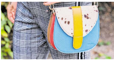
Schickes Accessoire und nachhaltig dazu: Die Taschen aus hochwertigem Leder sind aus Stücken gefertigt, die bei der Produktion in großen Manufakturen übrig bleiben und entsorgt werden würden. Damit wird jede Tasche zum Unikat.

ersten Blick nicht so wirkt.“ Neben den Vasen gibt es auch raffinierte Kerzenhalter, Körbe und Überöpfe, die ebenfalls komplett aus Altpapier hergestellt sind. Und auch für den Outdoor-Bereich gibt es Aufbewahrungskörbe, eine vielfältige Serie aus dem kostbaren Rohstoff Papier. Gefragt sind auch die Accessoires, die aus Lederresten hergestellt werden, die aus großen Manufakturen stammen. „Unser Hersteller fertigt aus hochwertigen Lederresten, die sonst